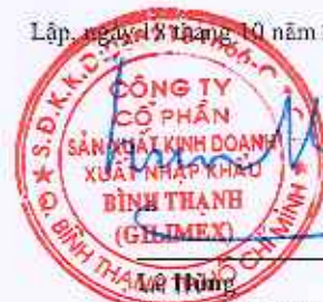
Chu tịch HĐQT